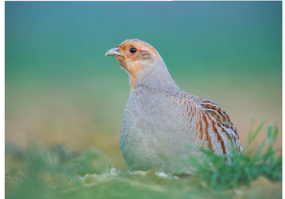
Rebhuhn–Vogel des Jahres