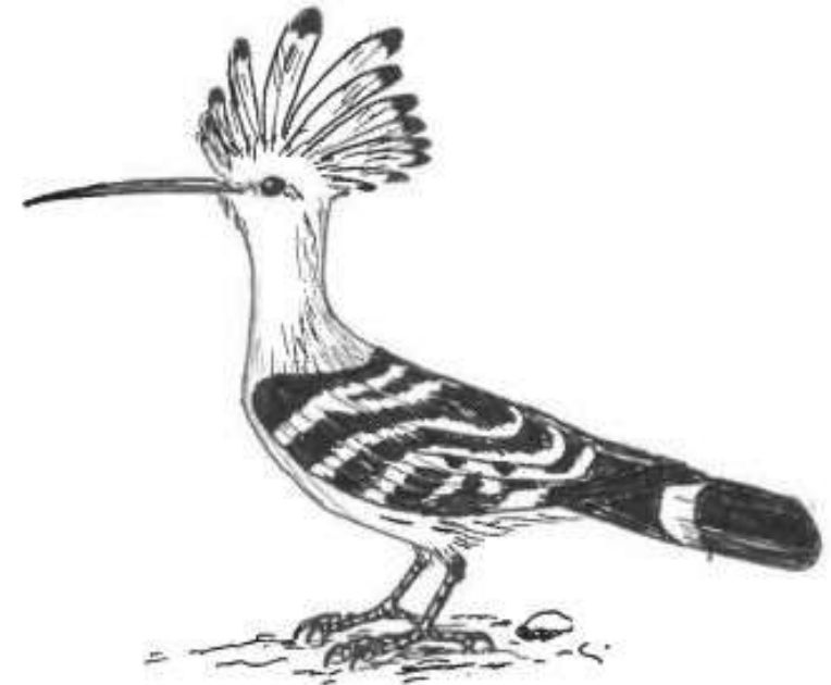
Wiedehopf – Vogel des Jahres