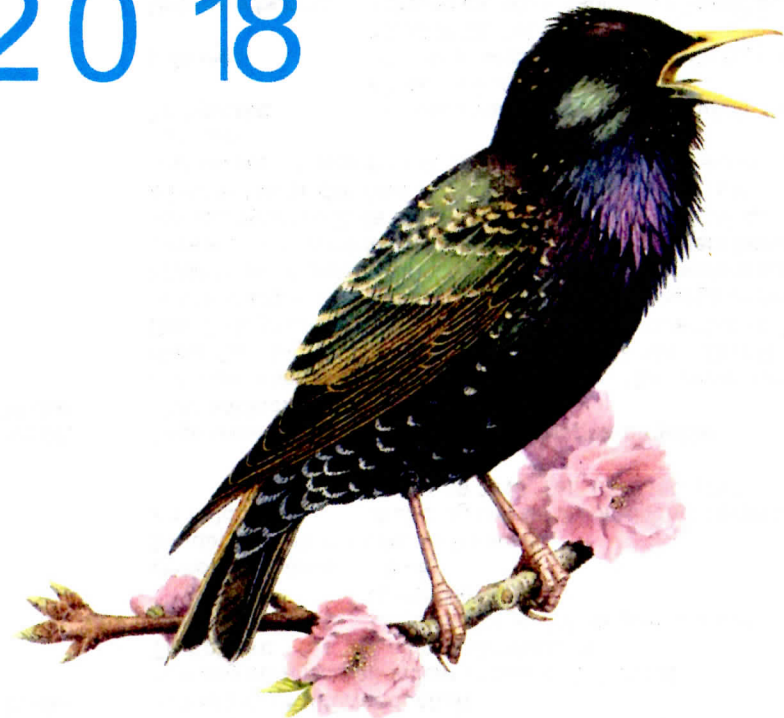
Der Star Vogel des Jahres