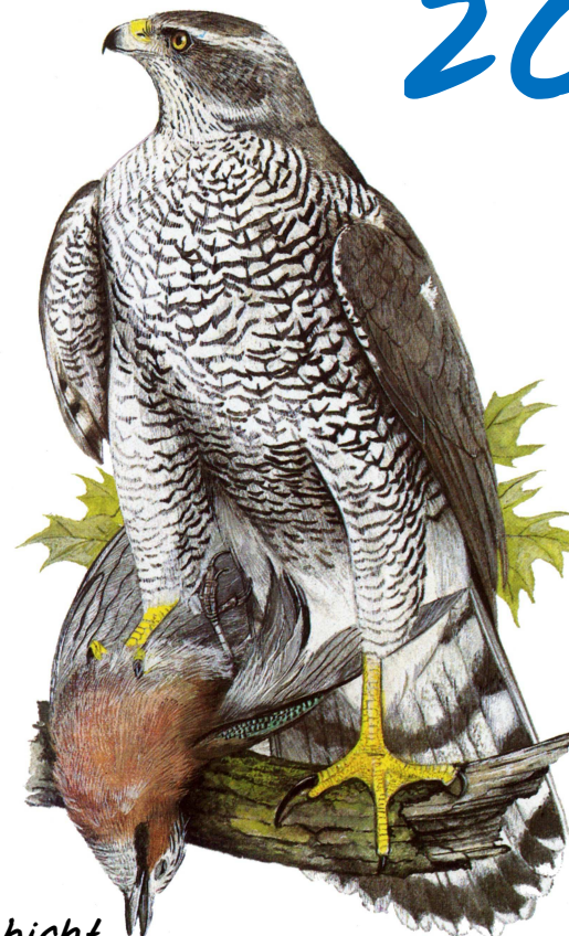
Der Habicht Vogel des Jahres