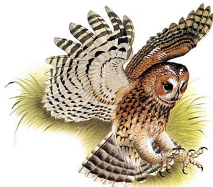
Der Waldkauz Vogel des Jahres